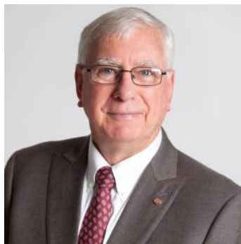
Ian Riseley Presidente 2017-18 Rotary International

No Rotary, nossa diversidade é nossa força. Essa ideia remonta aos primeiros anos da nossa organização, quando o sistema de classificação foi proposto pela primeira vez. O conceito por trás disso era simples: um clube com associados de origens diferentes e com habilidades diversas seria capaz de fornecer um melhor serviço do que um clube sem isso.