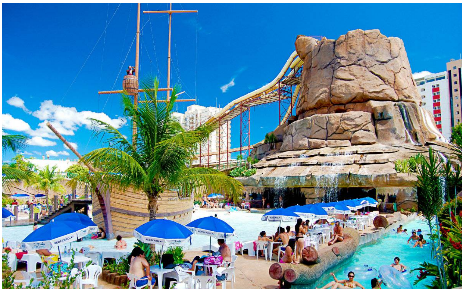
Di Roma Acqua Park

A Conferência Distrital (CD) nos trás possibilidades de conhecer lugares aprazíveis, descansar corpo e alma, estabelecer novas amizades, fomentar o companheirismo, dar uma atualizada em assuntos rotários e muitas outras coisas. É um evento para toda a família rotária do distrito, com possibilidade de inscrever convidados e amigos.