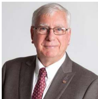
Ian Riseley Presidente 2017-18 Rotary International

Há 72 anos, a Organização das Nações Unidas foi fundada "para preservar as gerações vindouras do flagelo da guerra,... praticar a tolerância e viver em paz uns com os outros, como bons vizinhos". Apesar dessas aspirações dignas e das décadas de investimento para alcançá-las, o "flagelo da guerra" ainda está conosco: no ano passado, mais de 102 mil pessoas morreram em 49 conflitos armados pelo mundo, alguns dos quais com mais de 50 anos de existência. Terrorismo, intolerância e extremismo; a crise dos