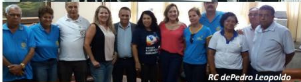
RC de Pedro Leopoldo