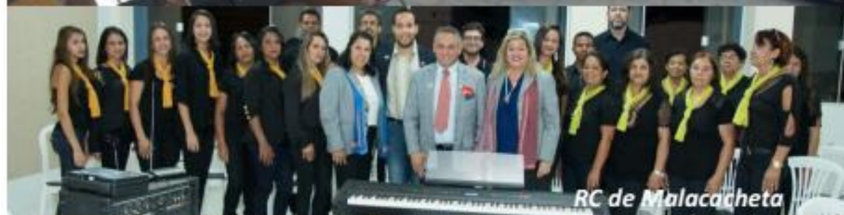
RC de Malacacheta