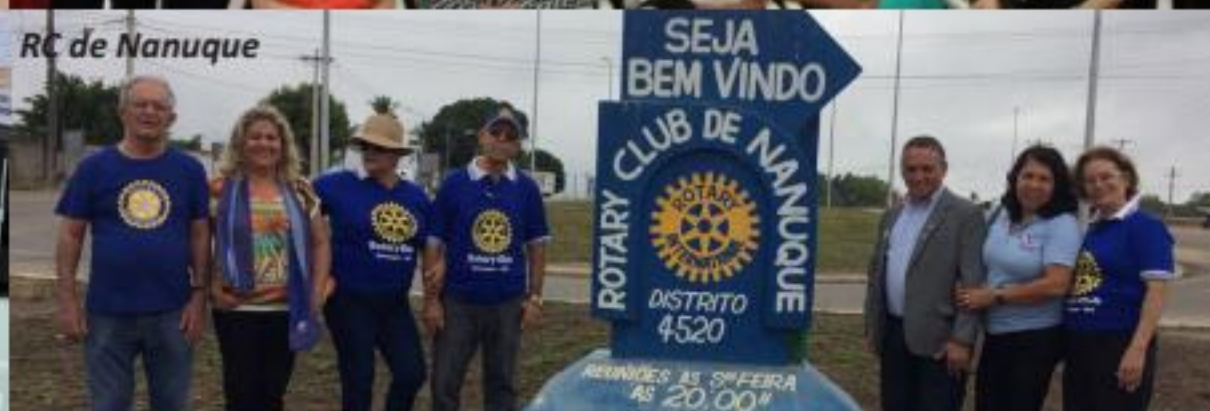
RC de Nanuque