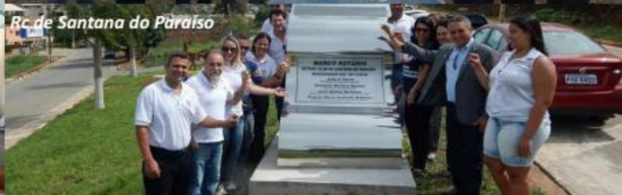
RC de Santana do Paraíso