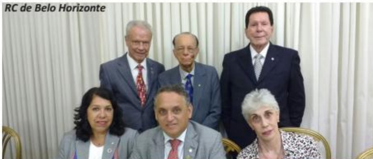
RC de Belo Horizonte