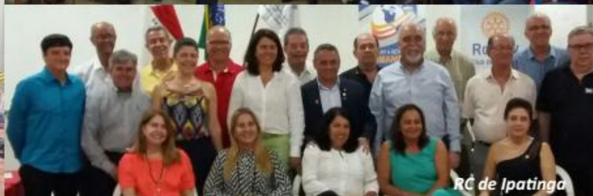
RC de Ipatinga