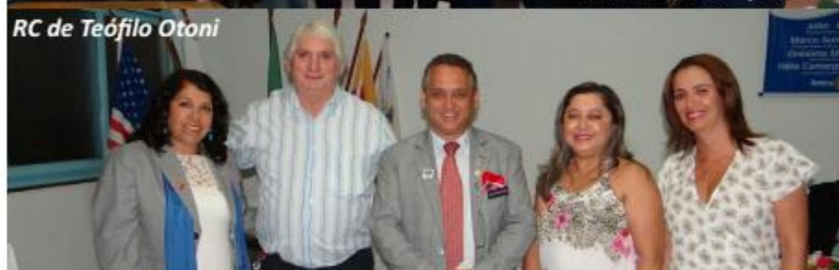
RC de Teófilo Otoni