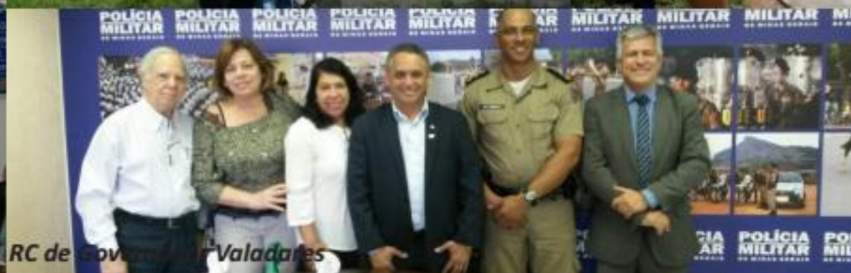
RC de Valadares

Rotarianos se inscrevam para a Conferência Distrital 2017 e aproveitem as condições especiais de pagamento