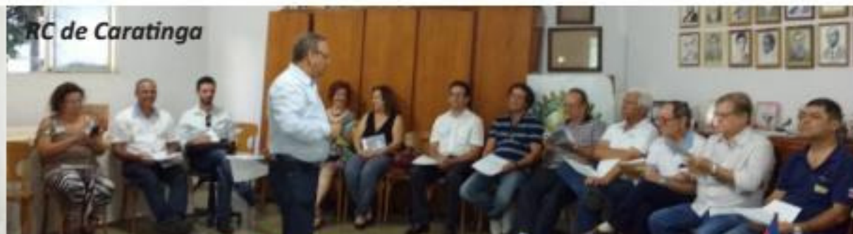
RC de Caratinga