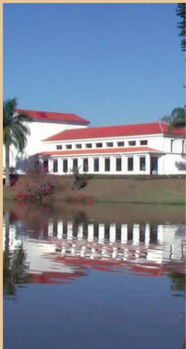
BALNEÁRIO de São Lourenço - MG