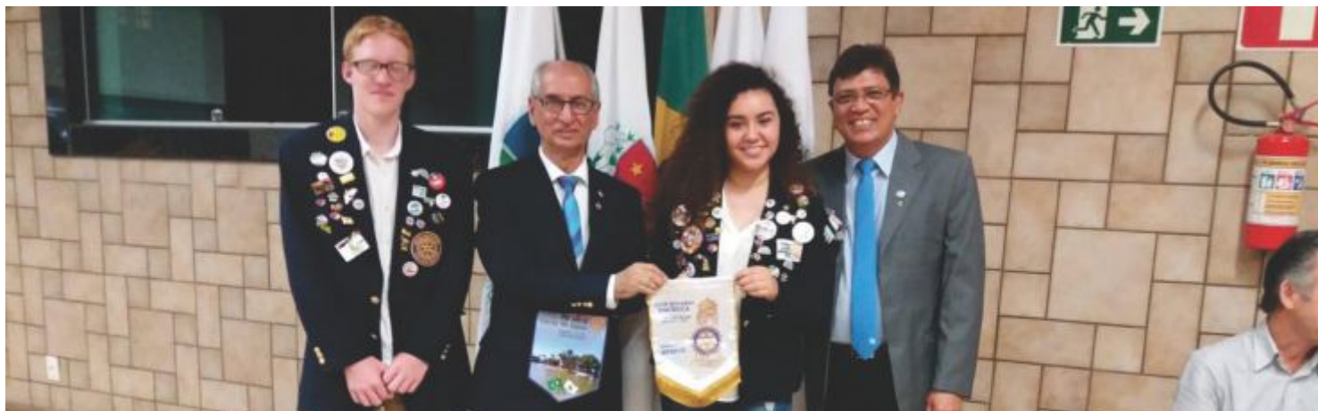
Intercambistas em Sete Lagoas/MG