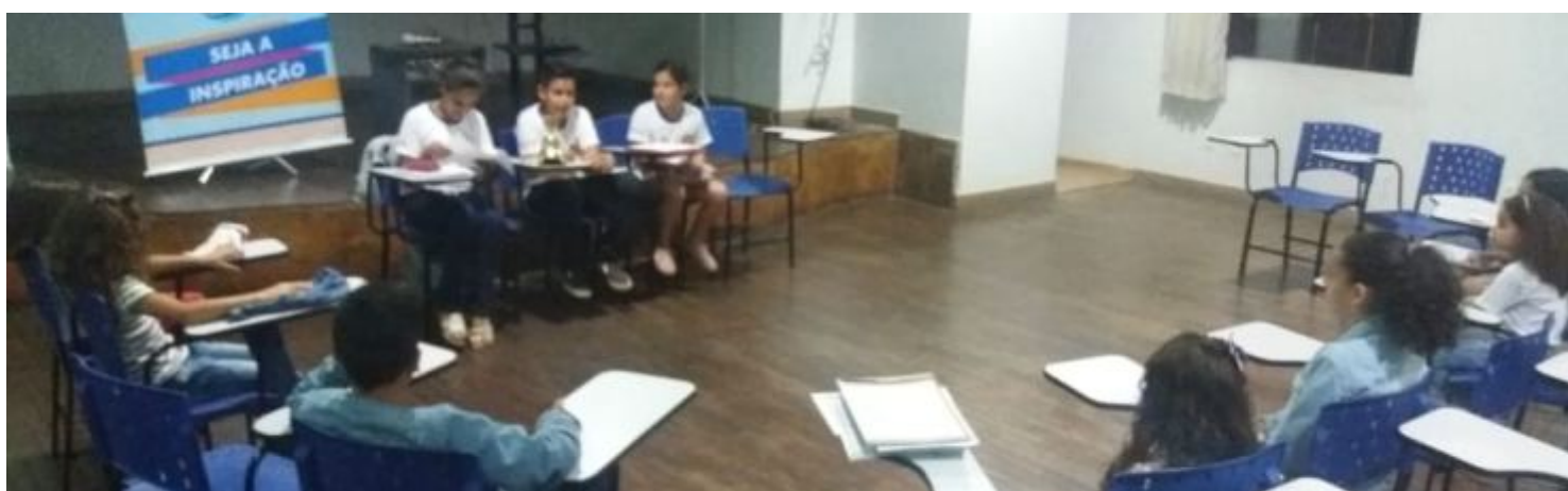
Primeira reunião do Rotary Kids de Turmalina, um orgulho para todos nós!