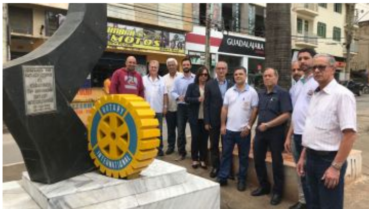
Rotary Club de Caratinga e Caratinga Leste 18/09/2018