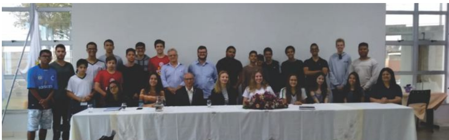
Interact e Rotaract Clubs de Itabira/MG